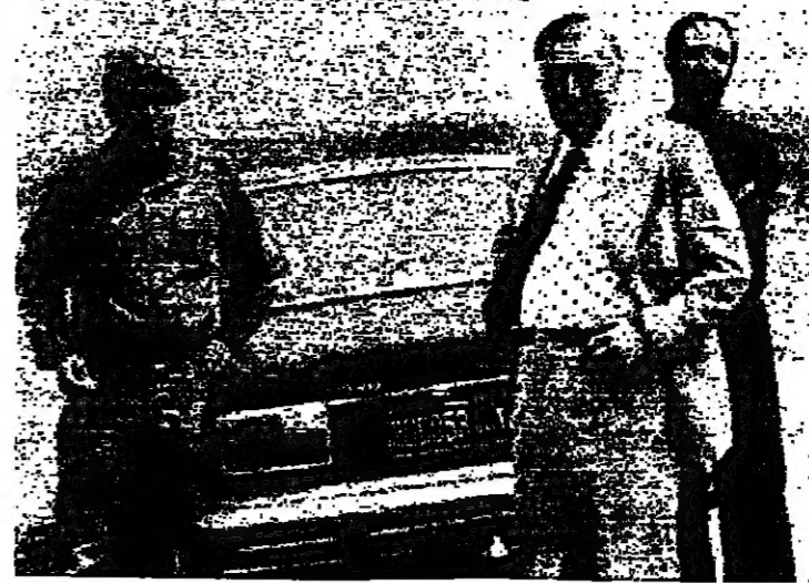
الرئيس حمادة في حزين أمس

أدى الرئيس صبري حمادة بحديثه الخاص «الاتوار» تناول فيه الأوضاع الراهنة رغم بعده عن جو العاصمة مدة اسبوع - استشهد حمادة ان تكون الأحداث الأخيرة التي عصفت ببلدان هي أحداث طائفية ، بل كانت نتيجة صراع سياسي ليس الا .